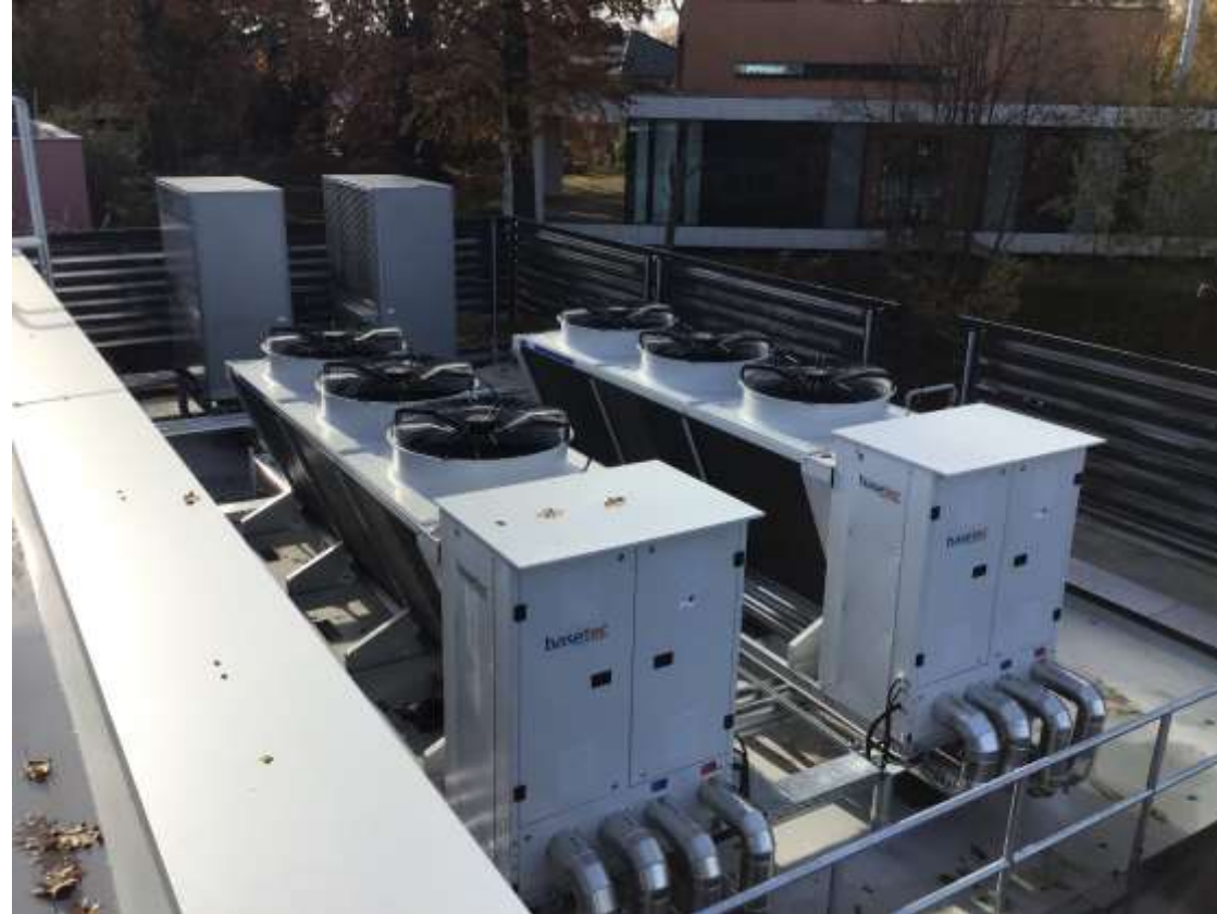
Neues Filialkonzept Wärmepumpen