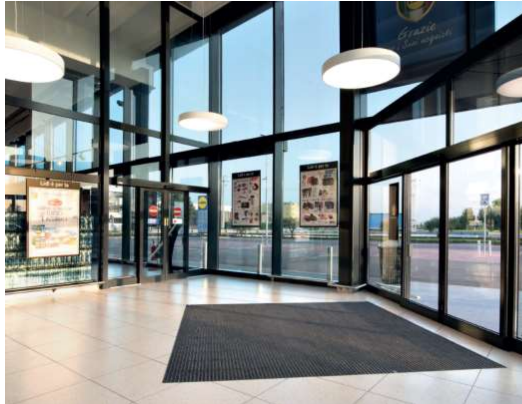
Neues Filialkonzept Großzügiger Eingangsbereich