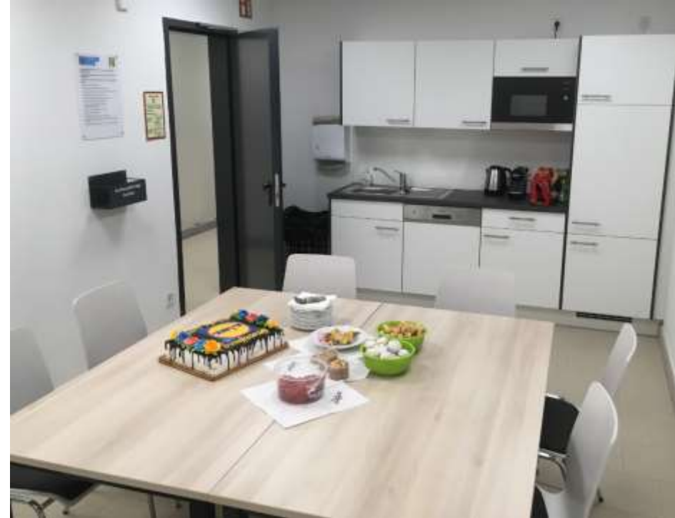
Neues Filialkonzept Pausenraum