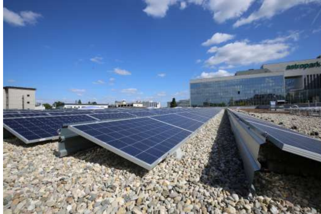
Neues Filialkonzept PV-Anlage