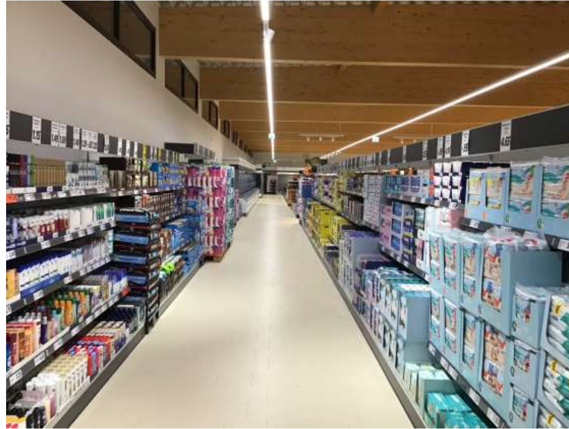
Neues Filialkonzept Niedrigere Regalhöhen