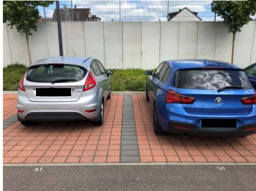
Neues Filialkonzept Größere Parkplätze