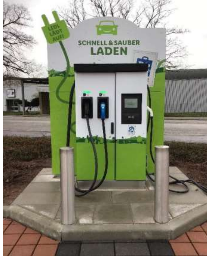
Aktuelle Filiale E-Tankstelle