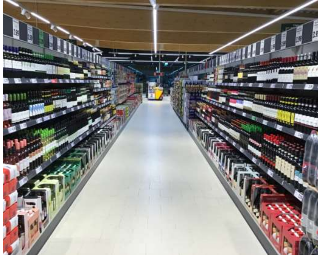
Neues Filialkonzept Breitere Gänge