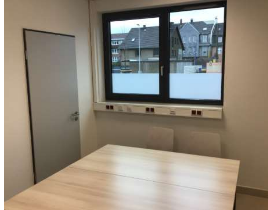
Neues Filialkonzept Besprechungsraum